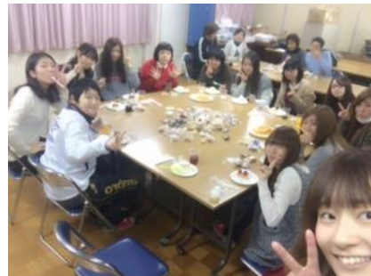
大学・短大生の送別会

留学生の寮生たちが、一時帰国する時期を考慮した結果です。この行事においても、昨年より大学生、短期大学部生たちだけでなく、高校生も企画運営に参加してくれ、盛大に会を催すことができました。