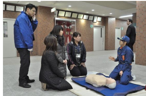
消防署員による救急救助法の説明