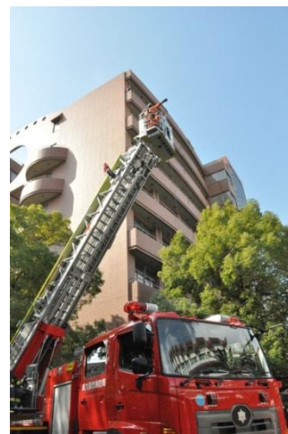
はしご車を利用した救助訓練