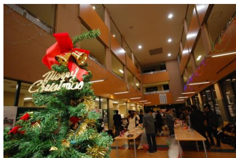
クリスマスパーティー

例年、入学式、七夕やクリスマスに合わせ、学生会・学友会が企画した新入生歓迎会等を行いました。特に、短期大学部50周年が盛り上がるよう電飾を追加購入し、クリスマスの時期に、さらに盛り上げた電飾を9号館ラウンジに設置しました。今年度も、情報教育センターの協力で正門の植え込みに規模の大きい電飾とツリーを設置し、点灯式を実施しました。