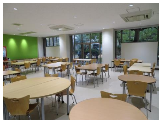
改修工事に伴い明るくなった8号館 学生ラウンジ

このため、教員の希望に答えながら、プロジェクタ、D・VD・ブルーレイ等の教材使用、語学授業におけるコンピュータ使用に対応した機器等の効率的に活用ができるよう注意を払って、新たな教室の運用と割り振りを行いました。