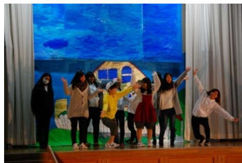
1号館3階舞台での卒業研究発表

老朽化の校舎の解体，建て替えに伴い、学科の備品や指導教室の移動等が生じましたが、学科教員の努力により、1号館の有効利用ができるようになりました。特に1号館3階の舞台のある部屋を使っての卒業研究発表ができるようになり、学生たちにとってより充実した教育環境づくりが少しずつではありますができてきています。