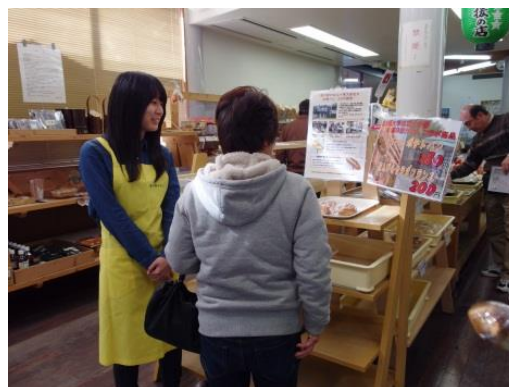
道の駅での販売の様子