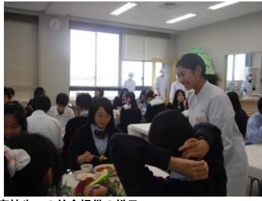
給食実習室（食堂）の装飾と高校生への給食提供の様子