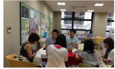
お客様とも楽しく談笑

7月12日、日曜日は第3回オープンキャンパスにて、アジアこども学科では、留学生さんによる中国茶のサービスがありました。台湾で人気のケーキ「鳳梨酥」と中国で人気のお菓子「番餅」を用意しました。アジアこども学科の特別メニューコーナーにはたいてい親子連れのお客様が立ち寄ってくださいました。