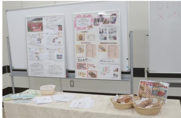
卒業発表会及び展示会の様子