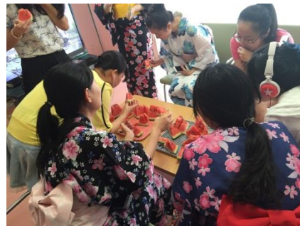
スイカを頬張る留学生たち

留学生にとって、日本の文化体験の意味合いも持たせ、恒例としている行事です。寮の各所に七夕飾りを飾り付け、浴衣の着付けを体験してもらい、スイカを食べながら、少しでも、日本のこの時期に行われる行事を体験してもらいました。今年は留学生、学生別に 2 日に分けて実施しました。