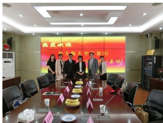
南京曉荘学院との協定書調

南京曉荘学院の責任者と協議し、両大学の交流を推進する協定書を作成し、調印しました。現在17の学院（学部）を擁し、本科在籍学生数15700人の総合公立大学となっている南京曉荘学院の前身は、1927年3月に近代中国の著名な教育者陶行知によって設立された「曉荘試験郷村師範学校」でした。殊に教員養成を特色とする教師教育学院