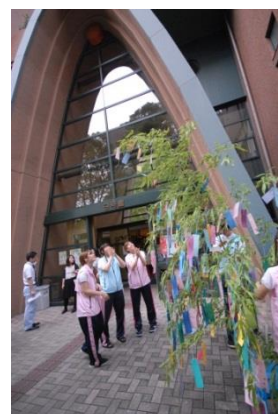
七夕祭りの飾りつけ

また、附属幼稚園とのコラボとしてのランタン作りを実施し、七夕まつりでランタンを学内に飾り点燈しましたが、近隣の人たちにも楽しんでもらうことができ、こちらも好評でした。