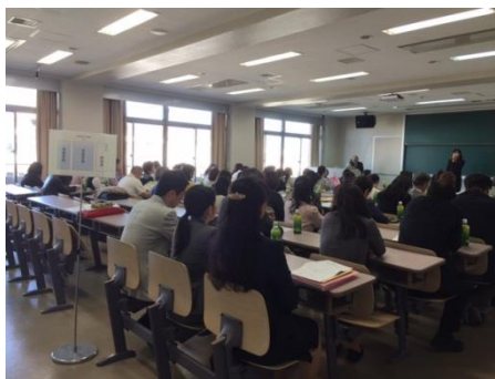
教育懇談会の様子

その後、大学、短期大学部それぞれ学科ごとに分かれての個別相談会が開催され、学科長が中心となって担任あるいはゼミ担当者が、成績に関する質問や就職に対する質問などについて、懇切丁寧に応