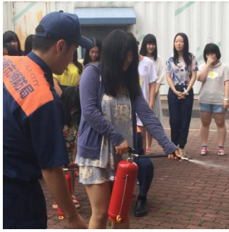
消防署員の指導による消火訓練

毎年行われている寮の防災訓練ですが、寮生の中に多くの留学生がいることを事前に知ってか、東大阪西消防署の署員の方の中国語による挨拶があり、留学生は大喜びでした。