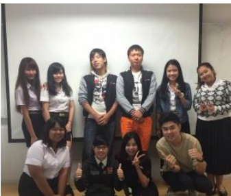
新入生歓迎会に2人も参加

9月24日、アジア地域文化研修を終えて4回生1人と3回生1人が無事に帰国しました。アジアこども学科の学生が毎年研修させてもらっているのは、提携大学のスウィーパトゥム大学です。タイの首都バンコクにあります。